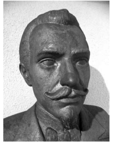
Vyskupo Antano Baranausko ir rašytojo Jono Biliūno biustai, kuriuos sukurti užsakė rašytojas Antanas Vienuolis-Žukauskas.

palinkusio, kupiną krepšį laikančio jauno vyriškio figūra.