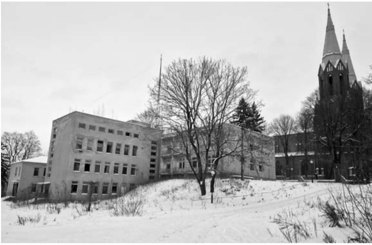
Jau penkiolika metų buvusioje Anykščių ligoninėje šeimininkauja tik benamiai.