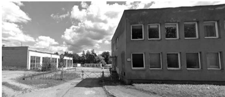
2020 metais bankrutavusio „Anresto“ pastatus pardavė bankroto administratorius.

Priminsime, kad bankrutavusi statybos bendrovė „Anrestas“