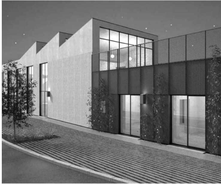
Sumanyta pastato renovacija kol kas gyva tik vizualizacijose.

Šalia pastato bus galima naudoti gatvės zoną staliukams ir kitiems lauko baldams, esant poreikiui įrengti