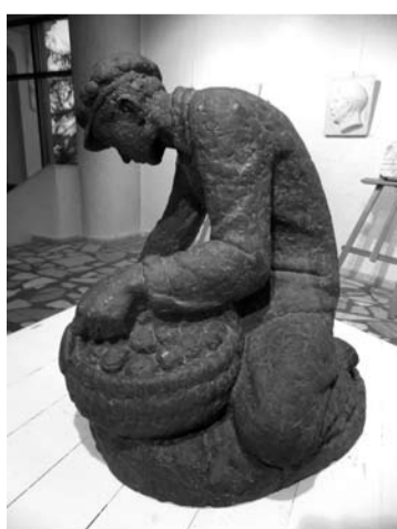
Įstabi bulves kasančio vyriškio figūra.